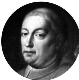
Николай Кузанский , крупнейший немецкий мыслитель XV в., философ, теолог, ученый-энциклопедист, математик (1401–1461)

Философия занята сама собой в том смысле, что она занимается основаниями нашего мышления и нашего образа мыслей.