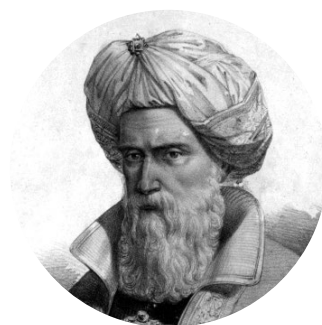
Ибн Сина, средневековый персидский ученый, философ и врач, представитель восточного аристотелизма (980–1037)

Мы говорили, что любая наука вырезает свой сегмент мира, задавая его онтологию, то есть определяя, что для нее существует, а что не существует, что она «видит», а чего «не видит». Нейронаука работает с мозгом и нейронными структурами, она по определению не работает с сознанием. Можно бесконечно усложнять структуру когнитивных, даже ввести квалитоны, но это никак не выведет вас к сознанию — точно так же как законы квантовой физики не объясняют законов социологии. В том, чтобы