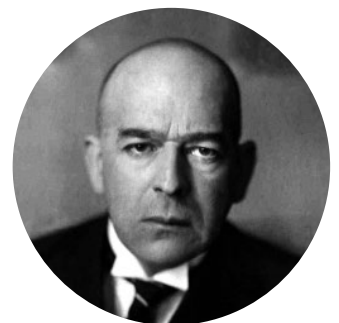
Освальд Шпенглер, немецкий философ, историк культуры, социальный мыслитель и публицист (1880–1936)

— Видимо, да. Когда я был студентом, в проезде Художественного театра (сейчас Камергерский переулок) были книжные магазины, столь же тогда многочисленные, как сегодняшние кафе. И в одном из них на втором этаже продавались книги из серии «Философское наследие». Тогда вышел двухтомник Николая Кузанского. Он мне страшно понравился и стал моим любимым философом. Видимо, это была такая случайность, которая оказалась закономерной.