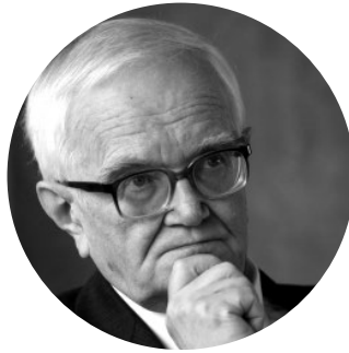
В.С. Степин , советский и российский философ и организатор науки, специалист в области теории познания, философии и методологии науки, философии культуры, истории наук (1934–2018)

интеллигенция, и клерикалы и т.д. Часто, к сожалению, позиции бывают несовместимыми, причем до всякой аргументации. Я думаю, что нам надо научиться не просто заявлять свой ответ, а его аргументировать и слушать оппонента. Строить разговор не как некую заявку: «Вот я сказал, хотите — соглашайтесь, или я не буду с вами разговаривать», — а как способность говорить на заданную тему, общую для всех нас.